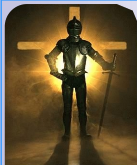
Put on the Whole Armor of God Ephesians 6:11